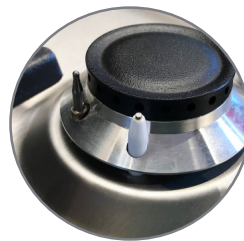
Gas Control System